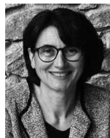
Olivier KLEIN Ministre délégué de la Ville et du Logement